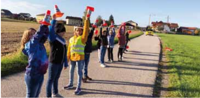
Das Auto fährt mit 50 km/h. Die Kinder markieren die Stelle, von der sie glauben, dass das Auto steht, wenn der Fahrer beim hinten auf der Straße stehenden Kegel zu bremsen beginnt.

Mit Hilfe der Feuerwehr wird dann auch die Fahrbahn bewässert und die Schülerinnen und Schüler sehen den Unterschied beim Bremsverhalten auf trockener bzw. nasser Fahrbahn.