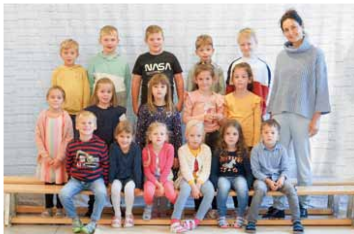
VS-HOCHBURG-ACH 2022/23 KLASSE IB FRAU KONEBERG